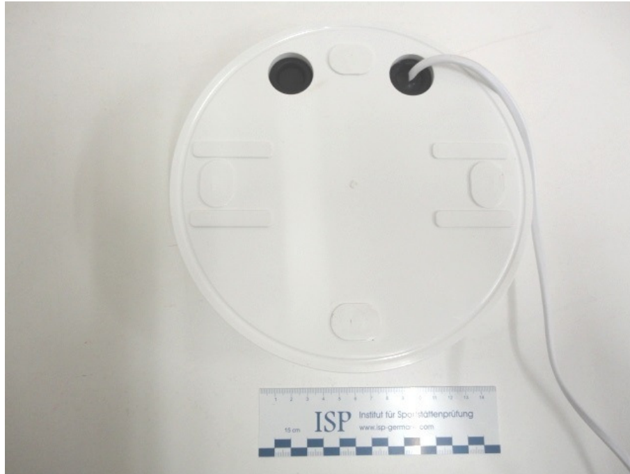
Abbildung 2: Ansicht der Rückseite