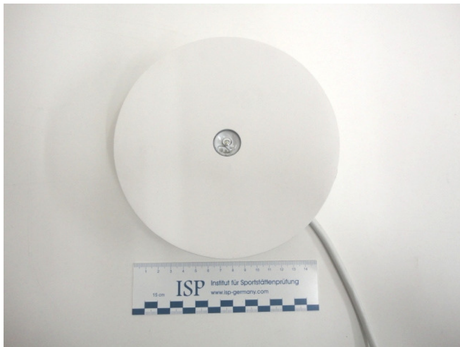
Abbildung 1: Frontansicht

Die Befestigung erfolgte kraftschlüssig an der Prüfdecke.