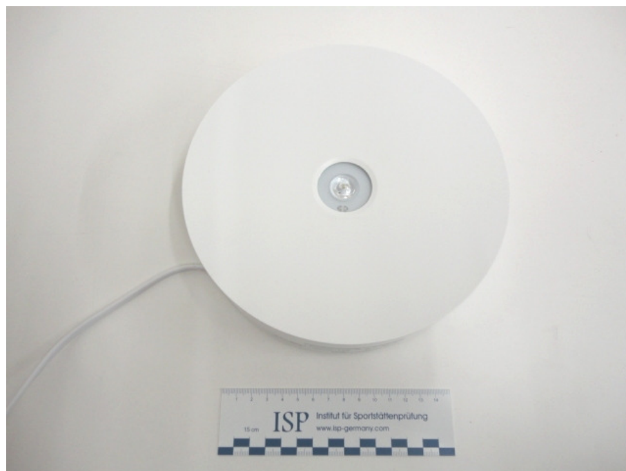
Abbildung 1: Frontansicht

Die Befestigung erfolgte kraftschlüssig an der Prüfdecke.